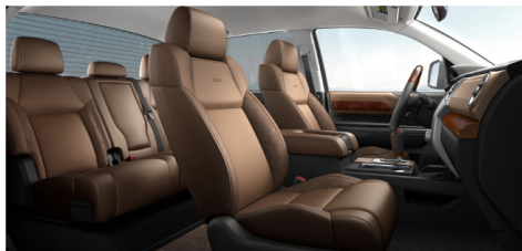
プレミアムブラウンレザー(1794EDITION)