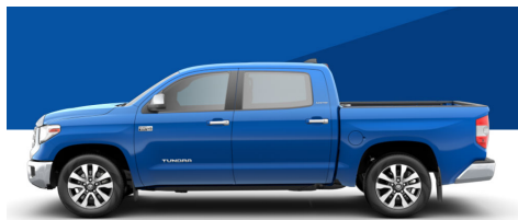
ウードゥーブルー