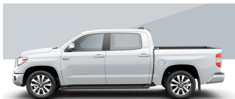
ウインドチルパール