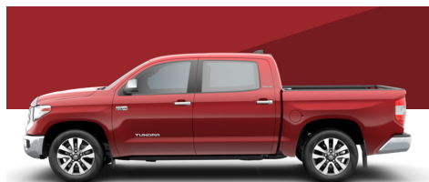
バルセロナレッドメタリック