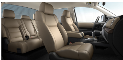
サンドベージュレザー(LIMITED)