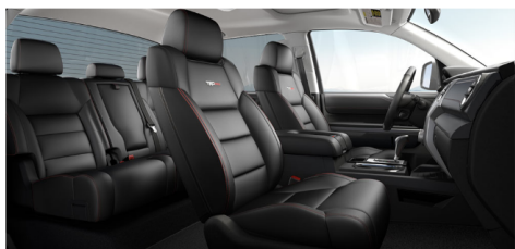
ブラックTRDPROレザーwithレッドアクセ ントステッチング(TRDPRO)