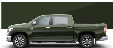
アーミーグリーン