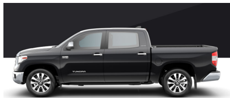
ミッドナイトブラックメタリック