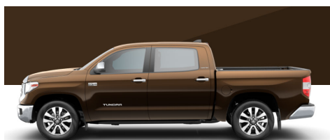
スモークドメスキート