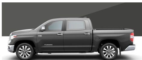
マグネティックグレーメタリック