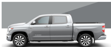
シルバースカイメタリック