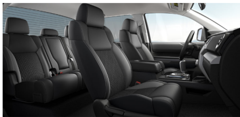
ブラックファブリックwithsr5アップグレード パッケージ(SR5)