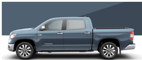
キャバリーブルー