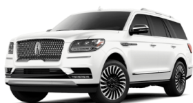
ホワイトプラチナム