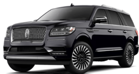
ブラックベルベット

P=Premiere S=Select R=Reserve B=Black Label (op)=オプション