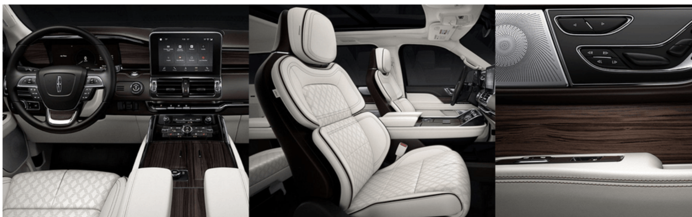
アルピンベネチアンレザー / リンカーンスターパーフォレーション ※ Black Label 専用色