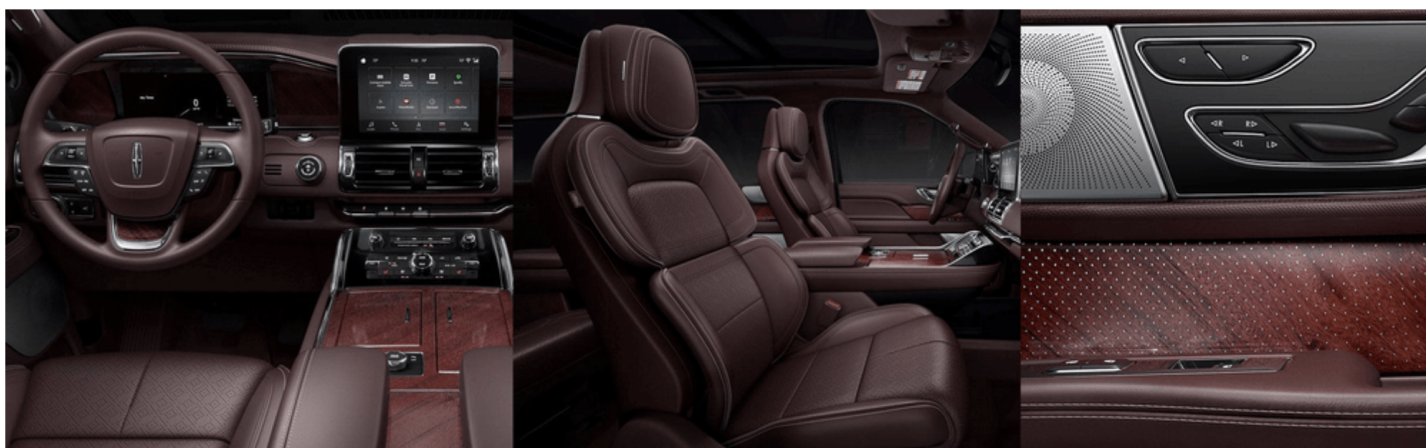
マホガニーレッドベネチアンレザー / ダイヤモンドウィーブパーフォレーション ※ Black Label 専用色