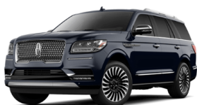
ラブソディブルー