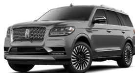
マグネティックグレイ