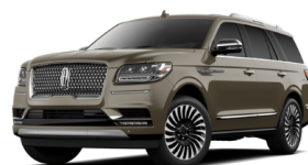
クロームモルテンゴールド