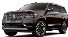
バーガンディーベルベット