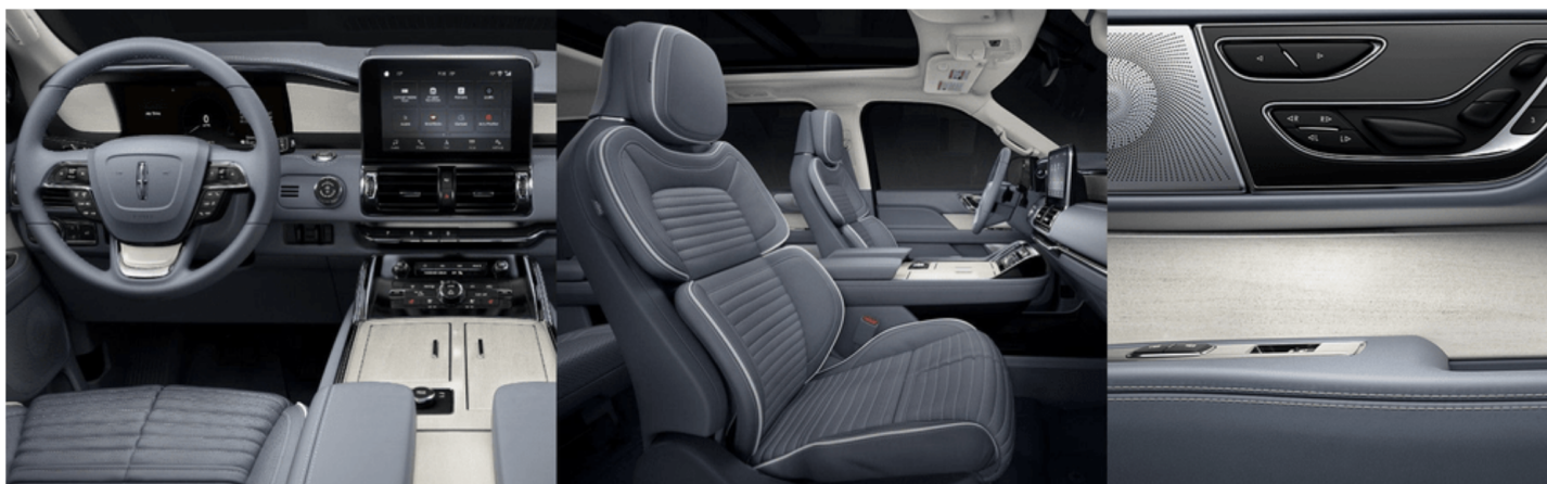
コースタルブルーベネチアンレザー / マイクロパーフォレイテッドエンハンスドリネア ※ Black Label 専用色