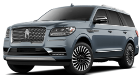
ブルーダイヤモンド