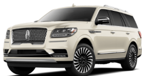
アイボリーパール