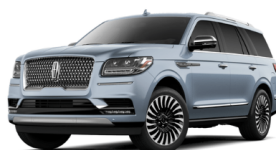
クロームブルークリスタル