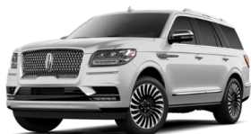
インゴットシルバー