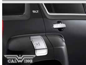
■クロームフューエルドア