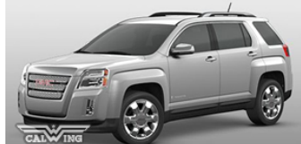
■クイックシルバーメタリック