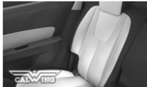
ライトチタニウムレザー