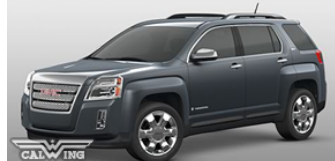
■サイバーグレーメタリック