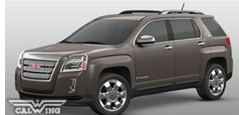
■モカスチールメタリック