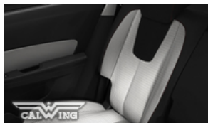
ライトチタニウムクロス