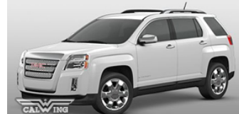
■サミットホワイト