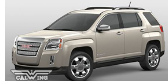
■ゴールドミストメタリック