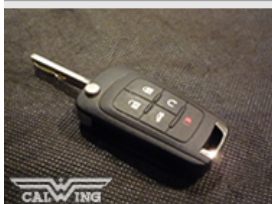
リモートエンジンスターター