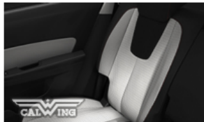
ライトチタニウムプレミアムクロス