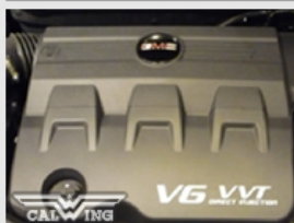
※SLE1を除くグレードで選択可能