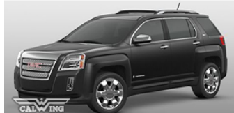
■オニキスブラック