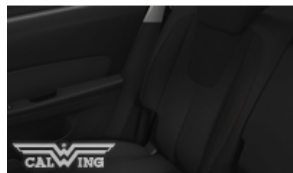
ジェットブラッククロス