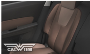
ブラウンストーンレザー