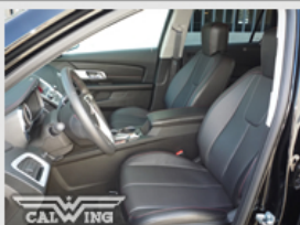
ヒーター付フロントシート