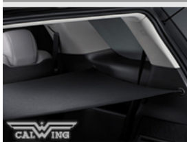
リアカーゴカバー