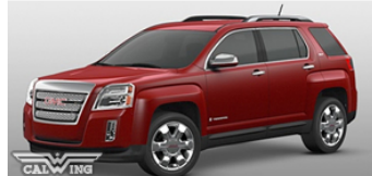
■メルロージュエルメタリック